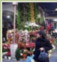
32ο ΓΕΛ Θεσσαλονίκης (οι παραδοσιακές αγορές)