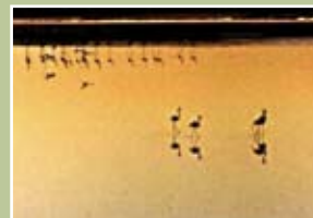
.Ε.Λ. Κυμίνων (Δέλτα Αξιού)

ντος και της λειτουργίας των αισθήσεων». Η τέχνη της φωτογράφισης χαρακτηρίζεται από την αίσθηση και τη σκέψη. Είναι μια συνεχής συνδιαλλαγή μεταξύ της «καρδιάς» και του νου.