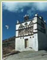
Γυμνάσιο Τήνου (πολιτισμός και περιβάλλον της Τήνου)