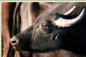
1ο ΤΕΕ Πολίχνης (Δέλτα Αξιού)

Η μαθητική ομάδα συγκροτείται με ελεύθερη βούληση των μαθητών, αφού ανακοινωθεί αρχικά σ' όλο το σχολείο η πρόθεση, να συγκροτηθεί περιβαλλοντι-