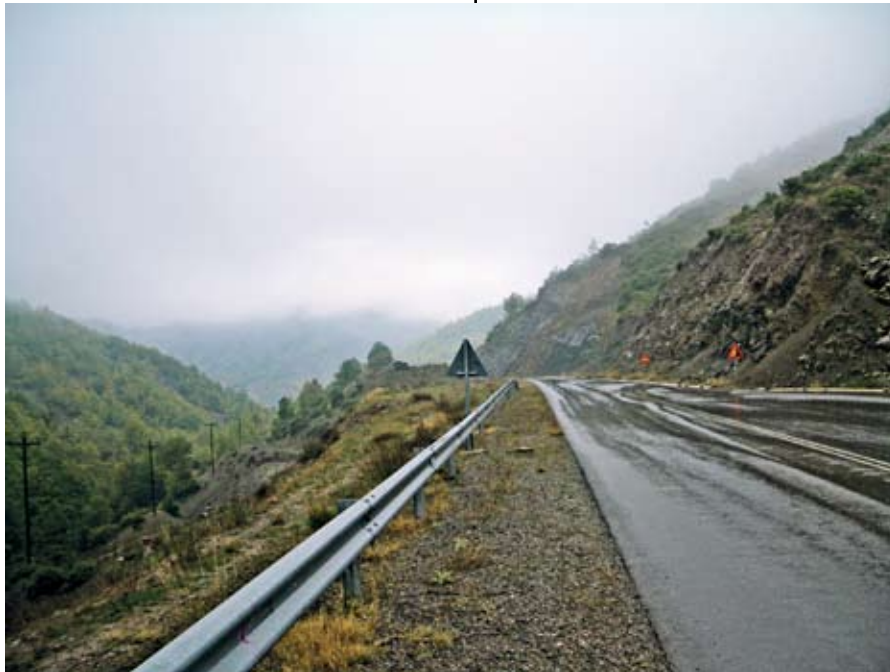
της Δέσποινας Σουβατζή