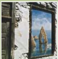
Λύκειο της Μήλου (Η ζωή στο νησί της Μήλου)