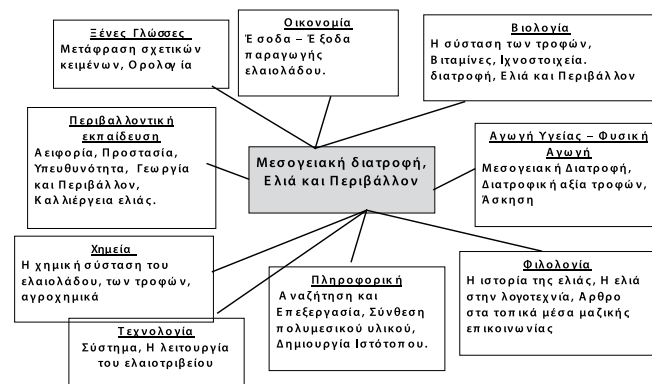
Σχήμα 3: Μαθήματα που σχετίζονται με την εργασία

Εκτός από το μάθημα της πληροφορικής, η εργασία υλοποιείται και στα υπόλοιπα μαθήματα σε λιγότερες διδακτικές ώρες. Στο μάθημα των αγγλικών και των γερμανικών, γίνεται μετάφραση και συζήτηση σχετικά με την εργασία. Στο μάθημα της βιολογίας, οι μαθητές συζητούν για τη διατροφική αξία των τροφών, ενώ στο μάθημα της χημείας, οι μαθητές συζητούν για τα λιπάσματα, τα φυτοφάρμακα, το pH του εδάφους. Στο μάθημα της Φυσικής Αγωγής μαθαίνουν πώς θα αξιοποιήσουν περαιτέρω την μεσογειακή διατροφή, συνδυάζοντας την με κινητικές δραστηριότητες για βελτίωση της φυσικής κατάστασης και επομένως της υγείας τους. Στο μάθημα της Γλώσσας, οι μαθητές συνθέτουν τα κείμενα που θα δημοσιεύσουν στον τοπικό τύπο, ενώ στο μάθημα της Λογοτεχνίας οι μαθητές μπορούν να ασχοληθούν με λογοτεχνικά κείμενα που αναφέρονται στην ελιά.