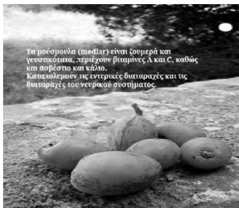
Τα μούσμουλα (medlar) είναι ζυμωρά και γεωπυκνότητα, περιέχουν βιταμίνες Α και C, καθώς και ασβέστιο και κάλιο. Καταπολεμούν τις εντερικές διαταραχές και τις διαταραχές του νευρικού συστήματος.

Παιδαγωγικό Ινστιτούτο, (1997), Εφαρμογές Πληροφορικής/ Υπολογιστών – Πρόγραμμα Σπουδών , (σελ. 3, 12).