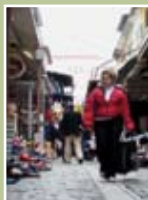
1ο ΤΕΕ Πολίχνης (η ζωή στην πόλη μας)