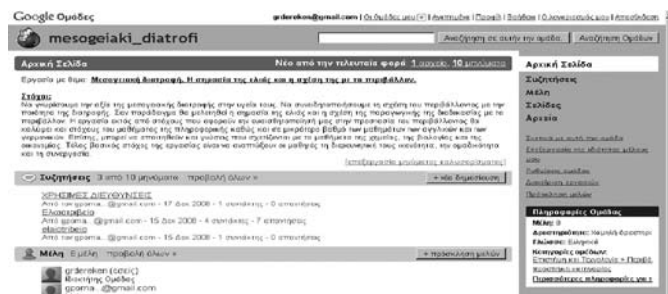
Σχήμα 2: Ηλεκτρονικός χώρος οργάνωσης των ομάδων της Google

Οι διαθεματικές εργασίες στο μάθημα της πληροφορικής, είναι πλήρως συμβατές και με το αναλυτικό πρόγραμμα του μαθήματος. (Παιδαγωγικό Ινστιτούτο, 1997). ενώ πετυχαίνεται συνήθως και η παραγωγή αξιόλογου λογισμικού ή ηλεκτρονικού υλικού. (Στράντζαλη – Καλκάνη Μ., Δερεκενάρης Γ., 2006). Για την οργάνωση της εργασίας, μπορεί να χρησιμοποιηθούν τα συνεργατικά εργαλεία που προσφέρονται δωρεάν στο Διαδίκτυο όπως οι ομάδες της Google, τα ιστολόγια, η από κοινού συγγραφή εγγράφων π.χ. Google Docs. (Κόμης 2006)