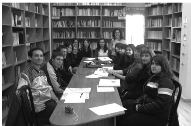
Σχήμα 1: Επίσκεψη στη δημοτική βιβλιοθήκη

Αφού συμφωνήθηκαν λοιπόν οι εργασίες, έγινε ο καταμερισμός των εργασιών. Οργανώθηκαν έξι ομάδες, κάθε ομάδα ανέλαβε δύο μήνες του ημερολογίου και ένα τμήμα του ιστότοπου. Έχοντας «υπογράψει κάθε ομάδα το συμβόλαιό» και ελπίζοντας ότι με όλη την παραπάνω διαδικασία, θα έχουν δημιουργηθεί οι εσωτερικές παρορμήσεις, ξεκίνησε η φάση της διεξαγωγής των δραστηριοτήτων. Στο τέλος θα αναφερθούν προβλήματα που παρουσιάστηκαν με τις ομάδες.