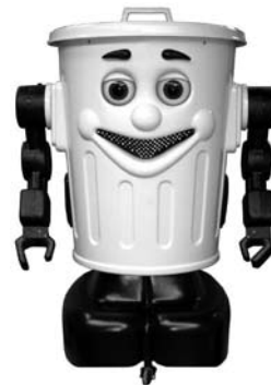
Εικόνα 1. Το ρομπότ της ανακύκλωσης

Πρόσφατα το Δ. Σ. της Ένωσής μας πληροφορήθηκε ότι το ΥΠΕΠΘ ενέταξε στο ΕΣΠΑ και προχωρά στην αγορά 300 ρομπότ – σκουπίδοτενεκέδων για να προωθηθεί την έννοια της ανακύκλωσης στις πρώτες τάξεις των Δημοτικών σχολείων. Τα ρομπότ αυτά με κατάλληλο λογισμικό θα προωθηθούν στις διευθύνσεις και οι Υπεύθυνοι Π.Ε. θα κληθούν να συντονίσουν τη διάθεση τους στα σχολεία.